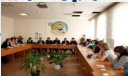
Круглый стол «Молодежь. Власть. Выборы»

Организована резервная группа членов молодежного парламента , куда вошли активные и целеустремленные подростки, волонтеры, ребята, принимающие активное участие в социально – общественной жизни района.